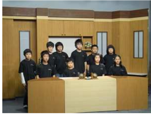
みんな緊張した様子でしたが、NGも少なく、楽しく収録できました。