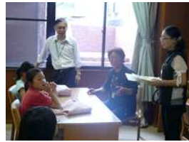
図書館の人と打ち合わせ。