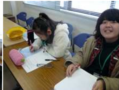
取材先にお礼状を書きました。