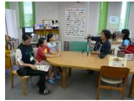
絵本の森で撮影しました。