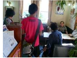
お店の人にお話を聞きます。