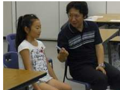
インタビューするのもされるのも緊張します。