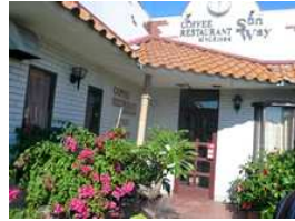
喫茶店サンウェイ