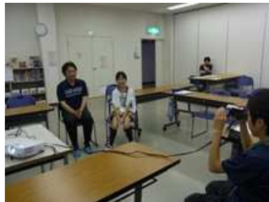
カメラの前にスタンバイ。