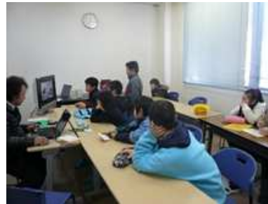
先生が編集しているPC画面をテレビに映し、みんなで見て学びます。