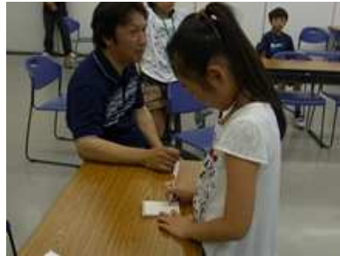
インタビューで聞くことをメモしています。