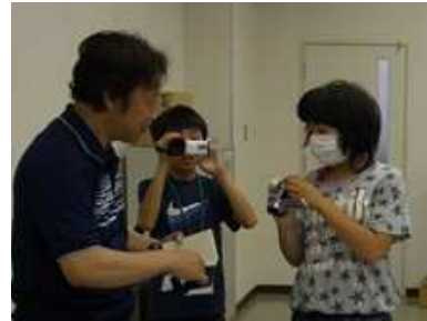
カメラ係は使い方のおさらいです