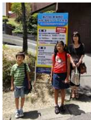
ディベートクラブ小学生も見学に行きました。