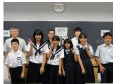
対戦相手の中学校と記念写真